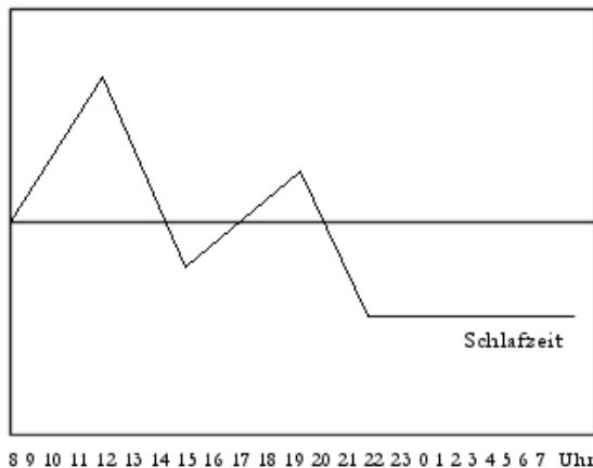
Alter Schlafrhythmus 8/16